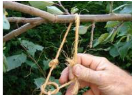
Afbeelding 2: Uitbuigen van pruimentakken.